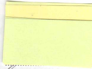
Mário Zuzic NÁJOMCA